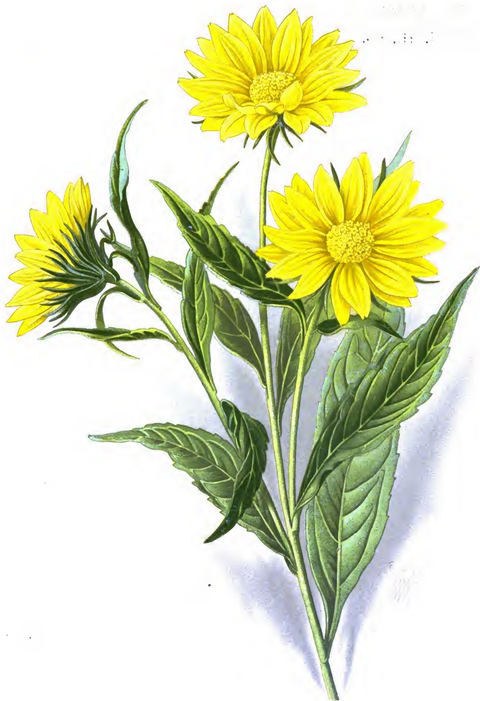
Helianthus giganteus L.